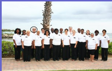
E Coro Ars Nova